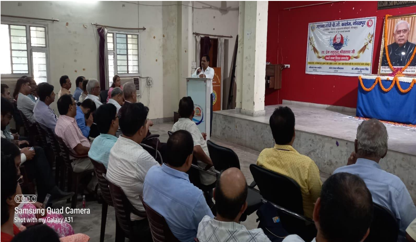
Samsung Quad Camera Shot with my Galaxy A31