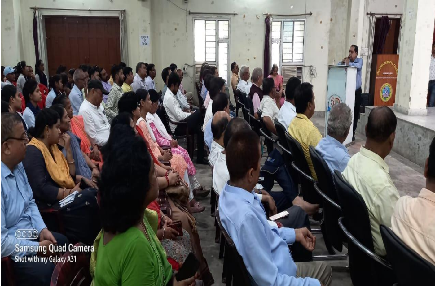
Samsung Quad Camera Shot with my Galaxy A31