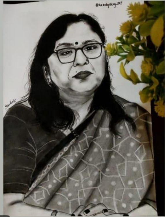
Art by- Shivani Chaurasiya