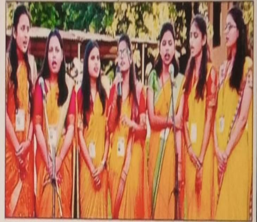
महात्मा गांधी पीजी कॉलेज में बृहस्पतिवार को भौतिक विज्ञान प्रयोगशाला के लोकार्पण कार्यक्रम में स्वागत गीत प्रस्तुत करती छात्राएं।

विविध खेल और सांस्कृतिक आयोजनों के लिए अलग-अलग महाविद्यालयों को नोडल केंद्र बना कर विभिन्न प्रतियोगिताओं का